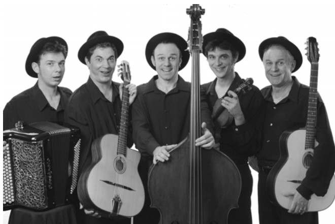
Les Pommes de ma Douche 2